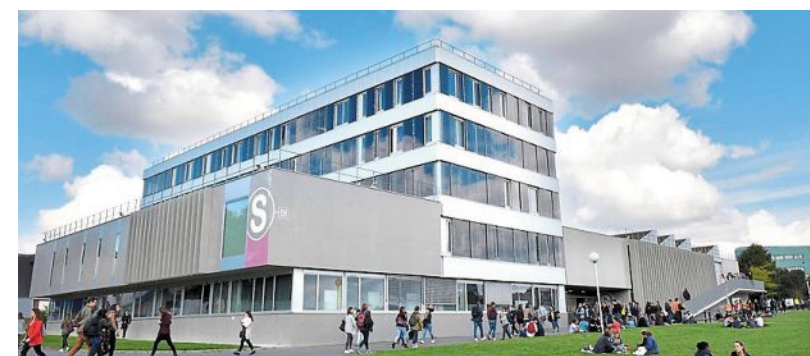
L'université confirme qu'elle « mettra en œuvre les moyens appropriés pour que l'ensemble des activités puisse débuter dès 8 h », mardi.

Le dispositif de sécurité sera renforcé à la fac, ce mardi, pour contrer le blocage voté par une poignée d'étudiants.