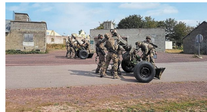
Des artilleurs du 11 e Rama, à l'entraînement avec des mortiers de 120 mm, l'un des matériels déployés en opération.

Basé près de Rennes, le 11 e régiment d'artillerie de marine se prépare à partir en mission.